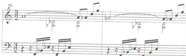
Ejemplo N° 3:

Considerando este hecho como la causa del desplazamiento en el bajo, convencidos de tratarse de una omisión, añadimos el silencio de negra en el tercer tiempo, y normalizamos los valores de la voz superior en el c. 47: