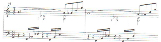
Ejemplo N° 4:

Situaciones como la anteriormente indicada se producen a menudo en los manuscritos, por lo que ofrecemos una solución que deriva de pasajes similares, correctamente resueltos, que la compositora nos ofrece en la misma obra.