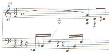
Ejemplo N° 2:

En los compases 46 y 47, la compositora obvia el silencio de negra en el tercer tiempo de la mano izquierda, colocando en su lugar un silencio de semicorchea y tres semicorcheas. El ritmo de este pasaje resulta así incongruente con la cifra indicadora del compás: